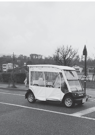
ナンバープレート・方向指示器などを装備し、輪島市内の公道を自動運転で走行するエコカート

能登半島の北西に位置す る石川県輪島市は朝の連続 テレビドラマ小説「まれ」 ゆかりの地で、輪島朝市や 漆塗りでお馴染みの豊かな 緑と日本海に囲まれた港町 である。人口約28600 人で、そのうち約43%が65 歳以上の高齢者となってい る。バスなどの公共交通機 関が少なく、財政的にも厳 しい輪島市において、商工