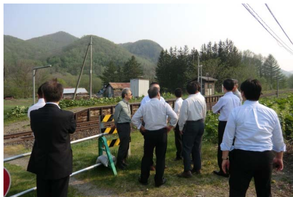
石北線「旧白滝駅」跡

北見市内では整備された鉄軌道跡（橋梁）を視察。その後、石北線の運行状況や沿線（遠軽駅含む）の状