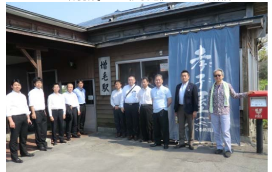
留萌線「増毛駅」前にて