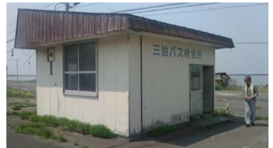
旧「羽幌線」の三泊駅施設はバス待合所に

今回の 3 日間にわたる視察を経て、PT における提言内容策定に資する視察となり、今後も引き続き中間答申策定に向けた取り組みを継続していく。