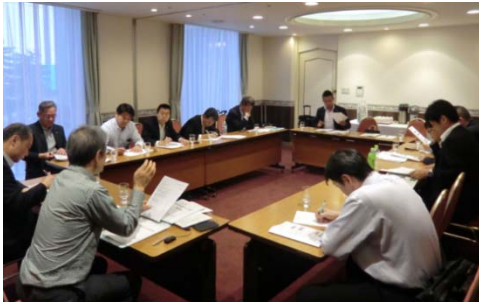
第 10 回会合の様子

況、今春のダイヤ改正において廃止された駅跡等の視察を行いつつ、旭川市へ向かった。旅客輸送という側面では極めて厳しい現状が垣間見えたが、北海道という巨大な農産物生産地の大量生産と大量輸送において、貨物鉄道の存在意義は大きいといった意見も出された。