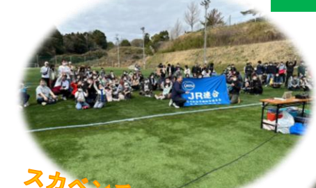
スカベンチャーも盛り上がりました！