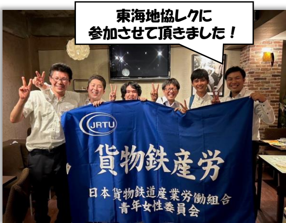
6月19日東海地協レク

開催は8月27日(日)、JR新橋駅近くの会議室に集合していただき、勉強会を行ってから場所を移動し、レクを行っていく予定となっております。ぜひ参加していただき、労組の枠を超えて絆を深めていただければと思っています。