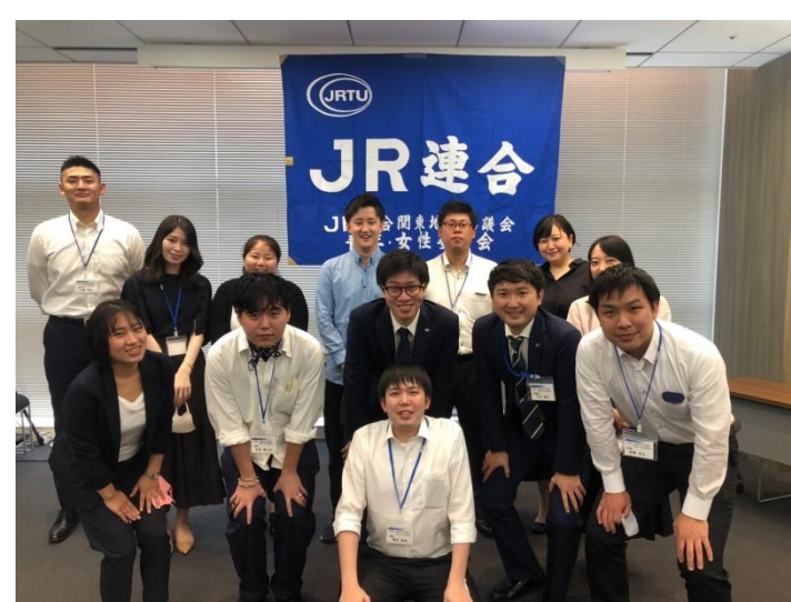
新旧役員+総会員写真

『つながるレール 広がる仲間 深めよう絆』～JRグループで働く仲間がともに思い、絆を深めよう～ 2021年11月27日発行