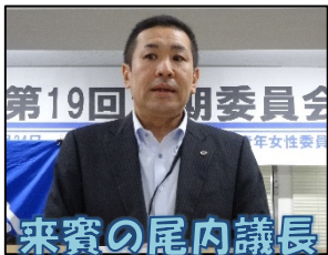
来賓の尾内議長 あいさつ