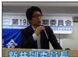
新井副委員長 方針案の提起