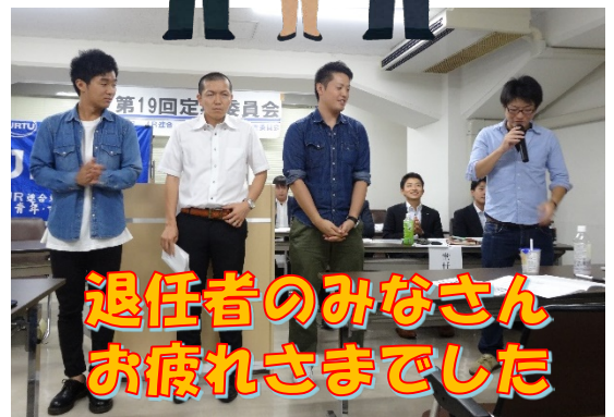
退任者のみなさん お疲れさまでした