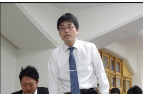
各機関からの質問 多くいただきました。