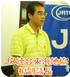
JR連合東海地協 榎副議長

平成26年5月31日(土)、東海地協「ファイティングスピリッツ2014」を開催しました。今年は静岡・愛知・岐阜・三重・長野の各県協に集うJR東海ユニオン、貨物鉄産労、東海交通事業、そして、近畿地協青年女性委員会の3名の方にも参加して頂き、総勢28名の仲間が参加しました。