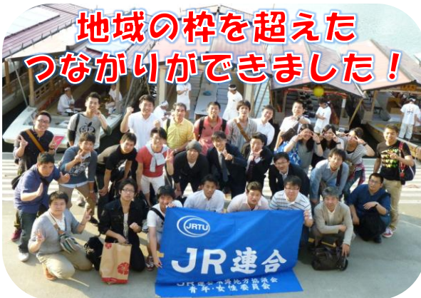
地域の枠を超えた つながりができました!