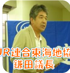
JR連合東海地協 榎副議長