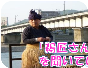
「鵜匠さんあるある」 を聞いていざ乗船!