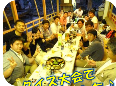
クイズ大会で 盛り上がりました!