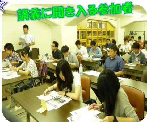
講義に聞き入る参加者

第2部は岐阜県長良川に場所を移して長良川の伝統漁法である「鵜飼」を鑑賞しながら、舟の上で鮎の塩焼きに舌鼓をうちました。また、チーム対抗のクイズ大会も大いに盛り上がり、東海地協の仲間だけでなく、近畿地協の仲間とも地協の枠を超えたつながりを作ることができました。