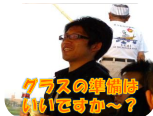
グラスの準備は いいですか~?