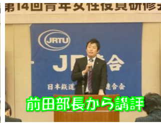
前田部長から講評