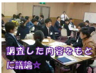
調査した内容をもとに議論★