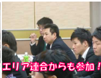
エリア連合からも参加!