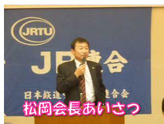
松岡会長あいさつ