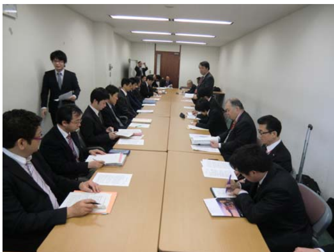
鉄道局との意見交換会（2013.4）

JR連合は、JR各社との意見交換を踏まえ、安全確立や耐震補強などの防災対策強化、青函共用走行問題、バリアフリー設備の投資促進並びにメンテナンスに対する支援を中心とする交通重点政策のとりまとめを行い、今年4月に鉄道局との意見交換会を行ったのを皮切りに、JR連合国会議員懇談会や政策プロジェクトでの議論を経て、太田国土交通大臣への要請、更には繰り返し鉄道局