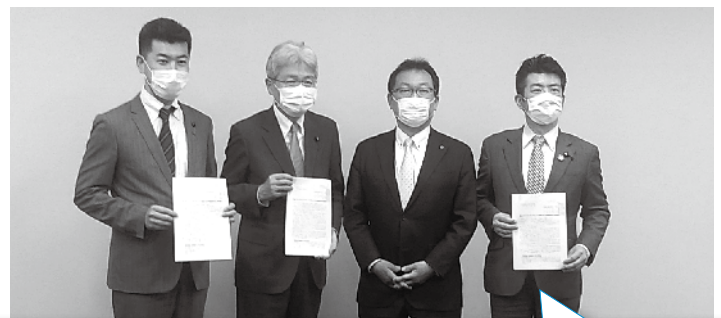
この間もJR産業への影響に鑑み、数次にわたる要請行動を実施。 （左：御法川国交副大臣、右：立憲民主党・国民民主党・社会保障を立て直す国民会議）

将来私たちが安心して働けるJR九州グループであり続けるために 署名活動に対してご理解、ご協力をよろしくお願い致します。