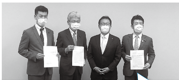
この間もJR産業への影響に鑑み、数次にわたる要請行動を実施。 (左: 御法川国交副大臣、右: 立憲民主党・国民民主党・社会保障を立て直す国民会議)

将来私たちが安心して働けるJR西日本グループであり続けるために 署名活動に対してご理解、ご協力をよろしくお願い致します。