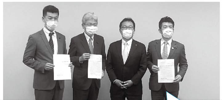
この間もJR産業への影響に鑑み、数次にわたる要請行動を実施。 (左:御法川国交副大臣、右:立憲民主党・国民民主党・社会保障を立て直す国民会議)

将来私たちが安心して働けるJR東海グループであり続けるために 署名活動に対してご理解、ご協力をよろしくお願い致します。