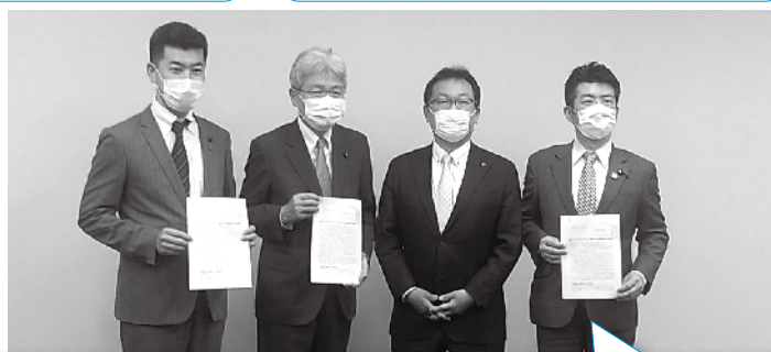
この間も J R 産業への影響に鑑み、数次にわたる要請行動を実施。 (左：御法川国交副大臣、右：立憲民主党・国民民主党・社会保障を立て直す国民会議)

将来私たちが安心して働ける J R 東日本グループであり続けるために 署名活動に対してご理解、ご協力をよろしくお願い致します。